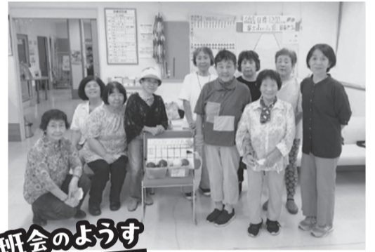
班会のようす 2025年10月

たんぽぽ班は12年程前、中川診療所を拠点にした班を作ろうという会員の声がかきつけで広め、今では10名程が月一回集まり、班会を開いています。