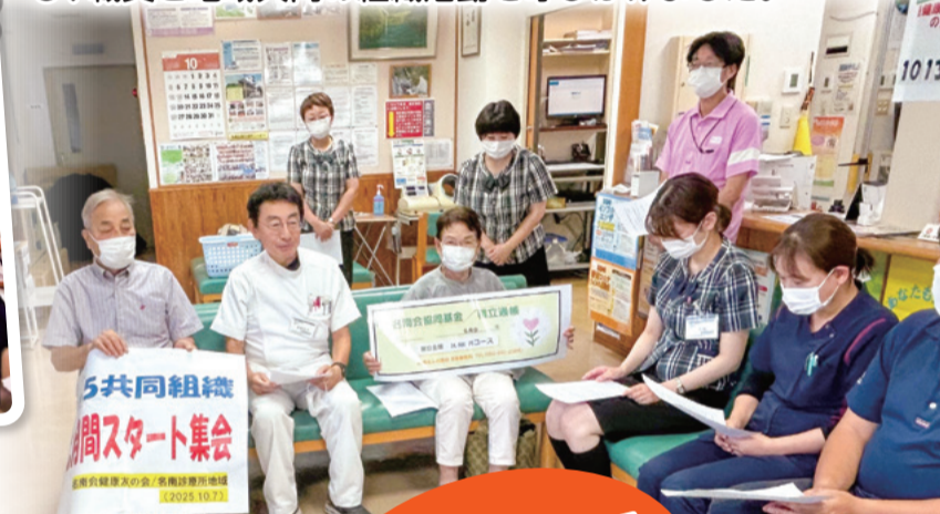
名南病院集会の様子