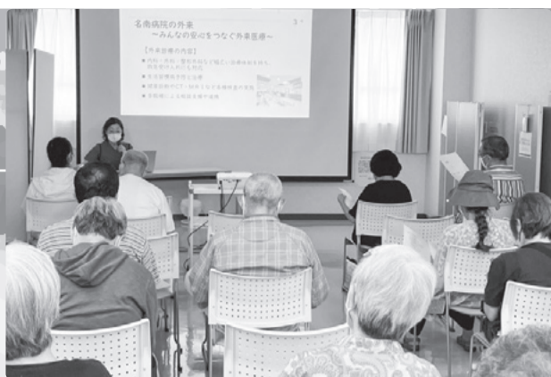
看護課小泉次長の話に参加者も真剣