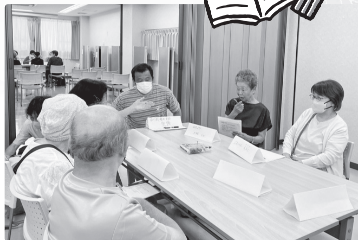
グループディスカッションではたくさんの意見交換がおこなわれました。

高騰の中、暑い厨房でもご苦労されていることも知りました。リハビリテーション課には90名もの専門職の方が在籍され、訪問リハビリの対応や小児から看取りの方まで幅広くチームで支援されていることを知りました。看護部門の「無差別平等の医療を目指し地域とも連携して安心のまちづくりに貢献します」のポリシーに大