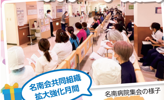
名南会共同組織 拡大強化月間