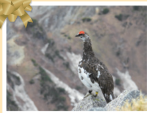
2025写真コンテスト 最優秀作品

●お送りいただいた写真およびデータはお返しできません。あらかじめご了承ください。