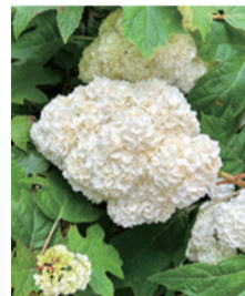
◆◆ 今月の花 ◆◆ アジサイ

発行 医療法人 名南会 名古屋市南区豊田 五丁目15番18号 発行責任者 小岩 朋宏 ☎052-692-2388