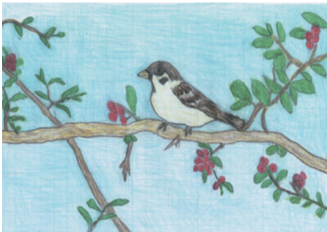
〔スズメ〕ピラカンサの枝に止まっている所