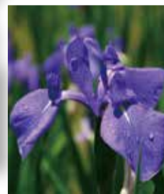
◆ 今月の花 ◆ かきつばた

4月1日(水)2026年度新入職員入社式を取りおこないました。今年度は16名の入職となり、これからそれぞれの現場に配属され、地域の皆様と一緒に「いのちと健康を守る」民医連・名南会らしい医療・介護を実践していきます。名南会各事業所の現場で皆様の担当させていただく機会もあるかと思ひます。どうぞご指導ご鞭撻のほどよろしくお願いいたします。