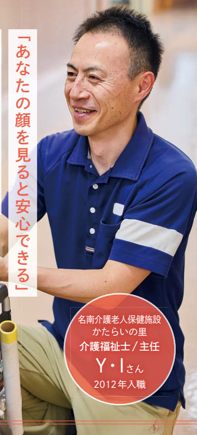
名南介護老人保健施設 かたらいの里 介護福祉士/主任 Y・Iさん 2012年入職