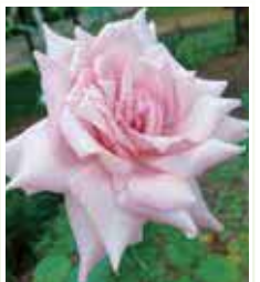
◆◆ 今月の花 ◆◆ バラ

発行 医療法人 名南会 名古屋市南区豊田 五丁目15番18号 発行責任者 小岩 朋宏 ☎052-692-2388