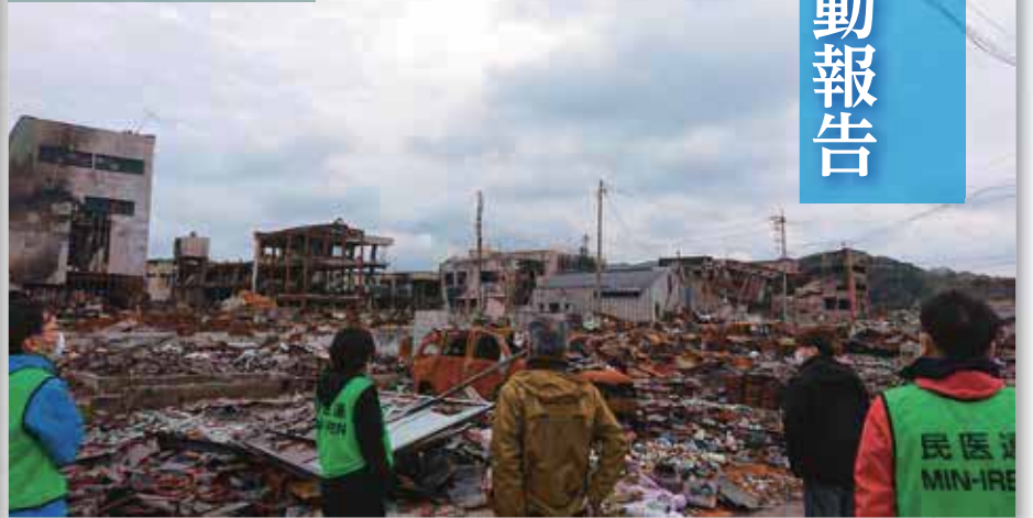
焼失した市街地の一部